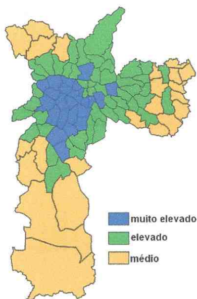
Mapa dos distritos de São Paulo por índice de desenvolvimento humano, de acordo com o Atlas de Trabalho e Desenvolvimento da Cidade de São Paulo - Atlas Municipal, em 2007.

A região é uma área carente com IDH médio e vulnerabilidade média. O Índice de Desenvolvimento Humano (IDH) é uma medida comparativa de riqueza, alfabetização, educação, esperança de vida, natalidade.